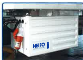
Stand-by-Kit für Standkühlung